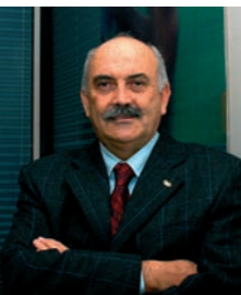
Franco Arese Presidente F.I.D.A.L.