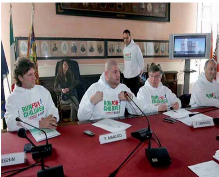
La conferenza stampa di presentazione di Run for Children

raccolto attraverso le iscrizioni alla staffetta, è stato pari a 50.250 euro, devoluto interamente al centro di oncologia pediatrica. Al di là