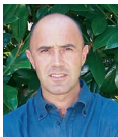
Andrea Bronzato Sindaco di Abano Terme

Un programma interessante e vario, che affronta molteplici tematiche legate allo sport e relatori qualificati sono, di certo, ingredienti che faranno del Convegno “ATLETICA-mente” un appuntamento di successo, uno stimolo e un aiuto per tutti coloro che hanno a cuore lo Sport ed in particolare l'Atletica.